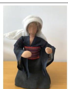
Nr. 6 Frau 3 (Maria)