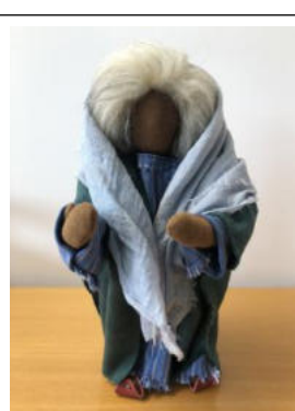
Nr. 8 Frau 5 (Sara)