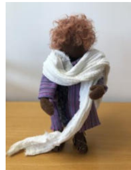
Nr. 12 Kind 1 (Zwölfjähriger Jesus)