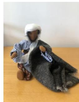
Nr. 24 Mann 2 (Jesus oder Abraham)