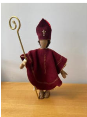
Nr. 31 Heiliger Nikolaus