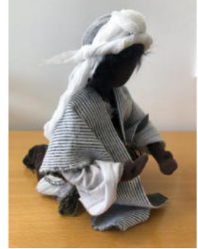
Nr. 21 Mann Jesus