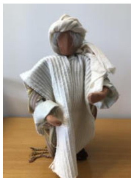
Nr. 23 Mann 2 (Jesus)