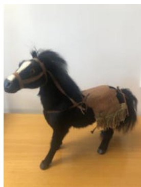
Tiere - Pferd