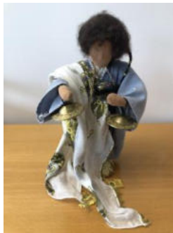
Nr. 11 Frau 8 (Tänzerin mit Zimbeln)