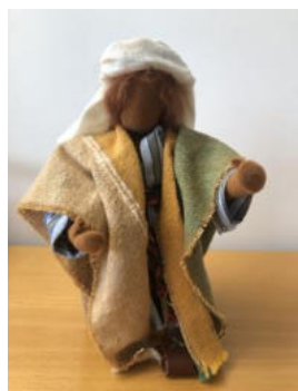
Nr. 25 Mann 4 (Jünger)