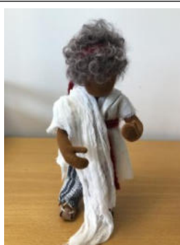
Nr. 17 Kind 6