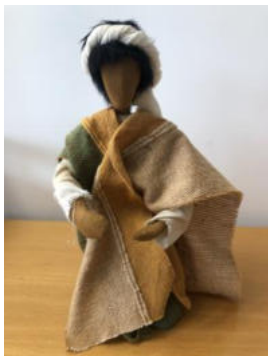
Nr. 22 Mann 1 (Jesus)