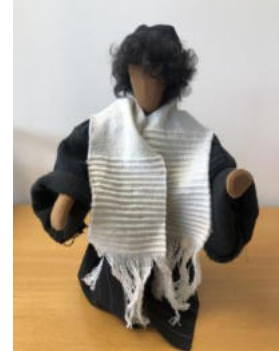
Nr. 27 Mann 6 (Jünger)