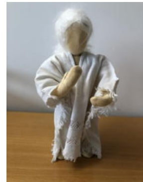
Nr. 3 Engel