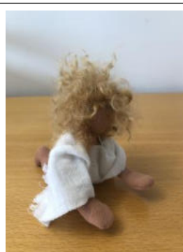
Nr. 14 Kind 3