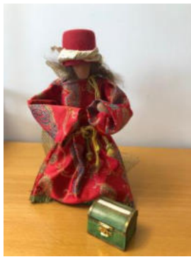
Nr. 19 König mit Schatzkiste