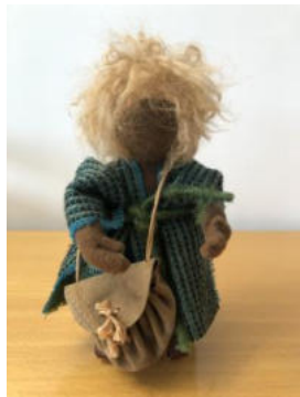
Nr. 13 Kind 2