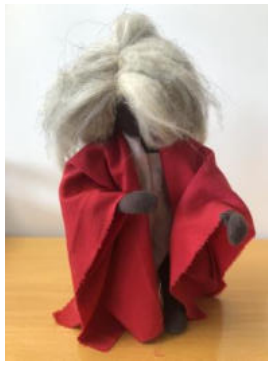
Nr. 2 Das Böse