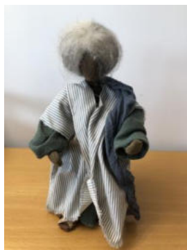
Nr. 4 Frau 1