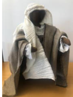
Nr. 20 Mann (Jesus Groß 40cm)