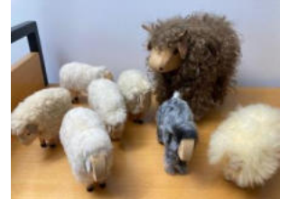
Tiere – Ein Stall voll Schafe (6 helle, 1 dunkles, 1 großes braunes)