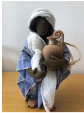
Nr. 10 Frau 7 (am Brunnen)