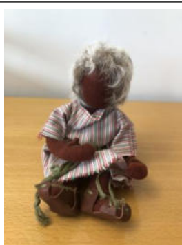
Nr. 16 Kind 5