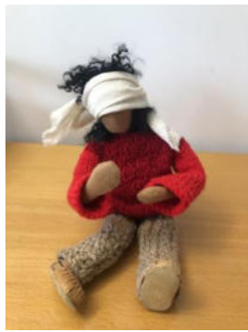
Nr. 1 Bartimäus