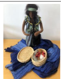
Nr. 9 Frau 6 – Tochter des Pharaos mit Mose im Körbchen