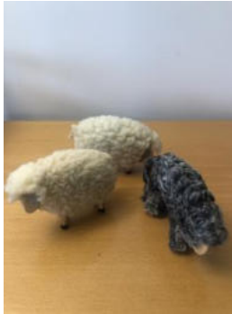
Tiere – 3 Schafe