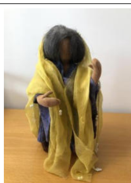
Nr. 5 Frau 2