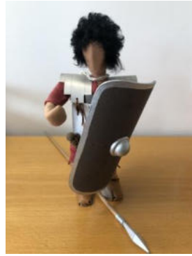
Nr. 29 Römer