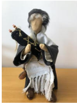
Nr. 28 Priester mit Tora-Rolle