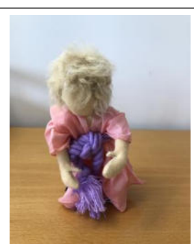
Nr. 18 Kind 7