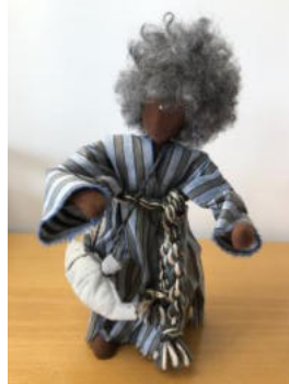
Nr. 26 Mann 5 (Jünger)