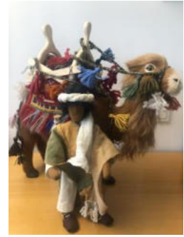
Nr. 30 Tiere – Kamel mit Hirte