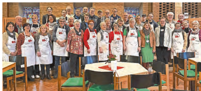
GROSSES TEAM mit großem Herz. Täglich machen mehr als 40 Ehrenamtliche die Vesperkirche möglich.

Für die Zukunft der Vesperkirche hat Droste einen Wunsch: „Dass es sie nicht mehr gibt. Dass kein Mensch mehr dieses Angebot annehmen muss.“ Doch Droste weiß auch, dass das ein frommer Wunsch ist. Deshalb machen er und die ca. 400 Ehrenamtlichen weiter. Für ihre Gäste. Mit viel Energie. Und noch mehr Herz.