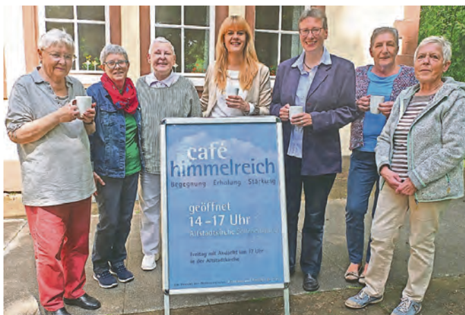
HIMMLISCHES TEAM: Die Haupt- und Ehrenamtlichen im café himmelreich.

Im Sommer locken Eiskaffee im Kirchgarten unter Kastanien und es gibt ein monatliches Programm.