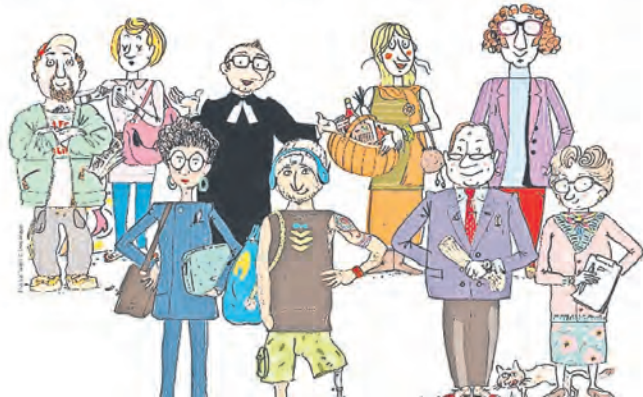
DU ermöglichst, dass aus dem ICH ein WIR wird.

22 neue Mitglieder der Stadtsynode gewählt. Und das erstmals aus den neu geschaffenen Wahlbezirken.