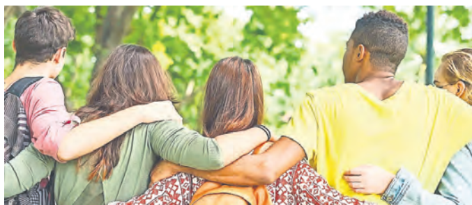
Jugendliche und junge Erwachsene finden ihren Platz bei nachhause kommen.

Weitere Informationen und Anmeldung zur Konfi-Landschaft 2026/2027 gibt's unter www.evangelisch-pforzheim.de/konfi